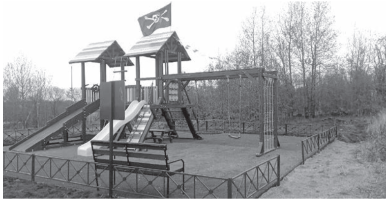
Обустройство детской игровой площадки в деревне Валяницы, Кингисеппский район