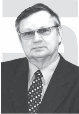
к.ф.н., член-корреспондент Петровской Академии наук и искусств

Вопрос следующего номера: Сталкивались ли вы с атихифобией? Это необоснованный и неконтролируемый страх потерпеть неудачу. Боретесь ли вы с таким страхом, который заставляет опустить руки, или преодолеваете себя, чтобы идти к своей мечте.