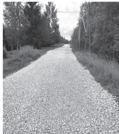
Ремонт дороги в деревне Новое Поддубье, Гатчинский район

Нашим комитетом постоянно совершенствуется областное законодательство в сфере самоуправления — сначала регион поддерживал старост, затем другие появившиеся формы местного самоуправления. И вот теперь всё объединено в одном законе. Это, на наш взгляд, будет стимулировать