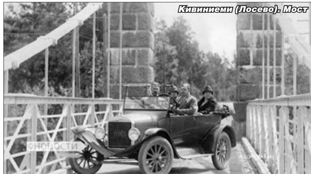
Кивиниеми (Лосево). Мост