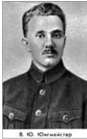
В. Ю. Юнгмейстер

22 (10 по ст. ст.) ноября родился летчик Василий Юльевич Юнгмейстер (1889-1938), один из организаторов гражданской авиации СССР. В мае 1915 года получил звание военного летчика в Гатчинской авиационной школе. Участник Первой мировой войны, был награжден Георгиевским крестом 4 степени. Во время Гражданской войны был начальником авиагруппы Туркестанского фронта.