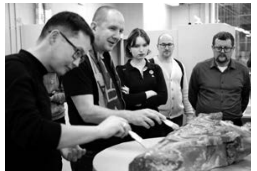
Участники форума посетили Международный центр реставрации в селе Рождествено

АЛЕКСЕЙ АСТАПЧИК ФОТО: АЛЕКСЕЙ АСТАПЧИК, МЕЖДУНАРОДНЫЙ РЕСТАВРАЦИОННЫЙ ЦЕНТР