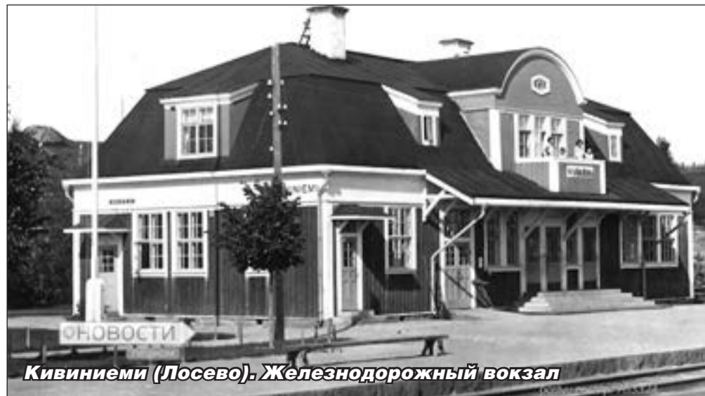
Кивиниеми (Лосево). Железнодорожный вокзал

— Вы здесь вдоль дорожки баннеры со старыми фотографиями этой местности повесили, молодец! Люди интересуются историей этого места?