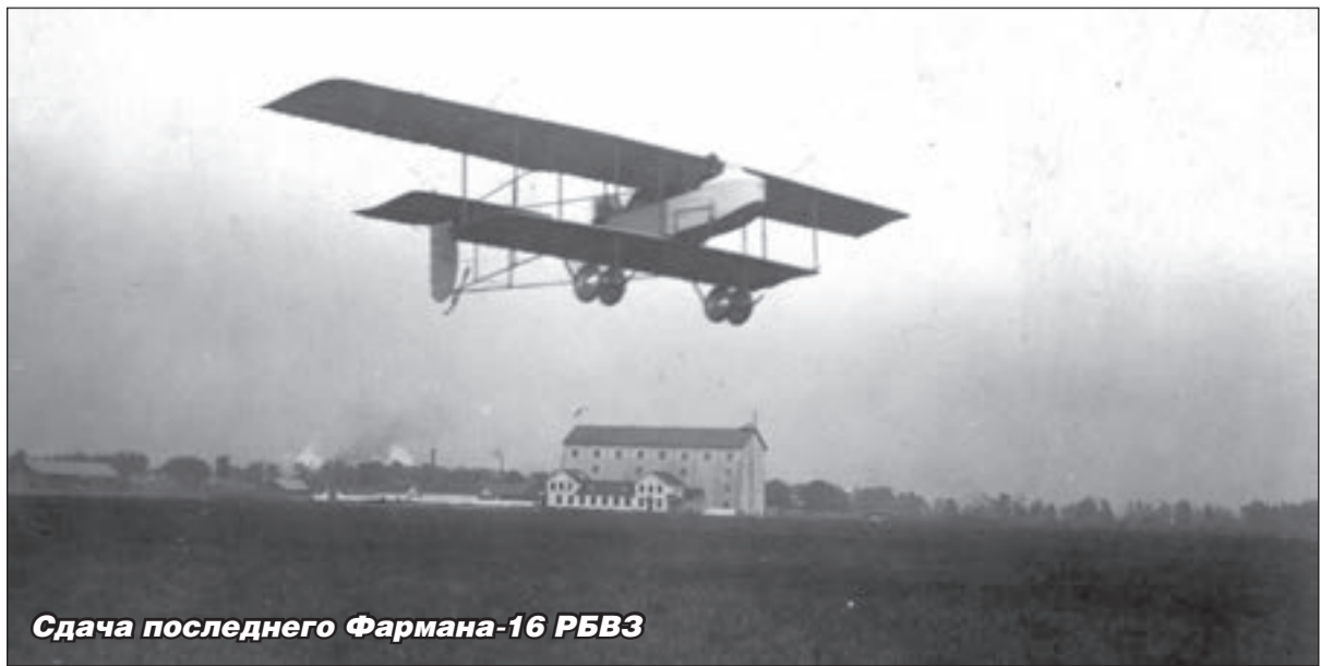
Сдача последнего Фармана-16 РБВЗ