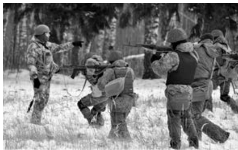
В Лужском районе бойцы проходят боевое слаживание перед отправкой на фронт