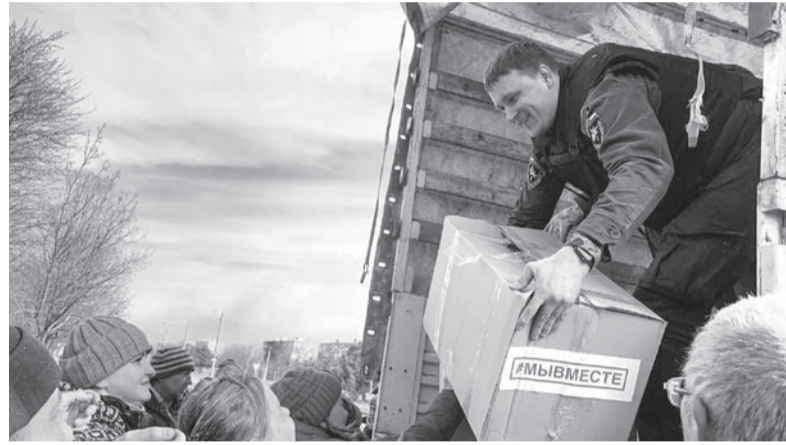
Волонтеры активно собирают помощь для наших защитников

Ещё одной востребованной мерой поддержки для семей мобилизованных стала губер-