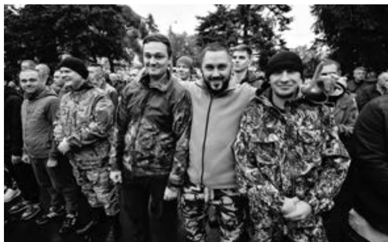
Меры поддержки доступны с момента поступления на службу