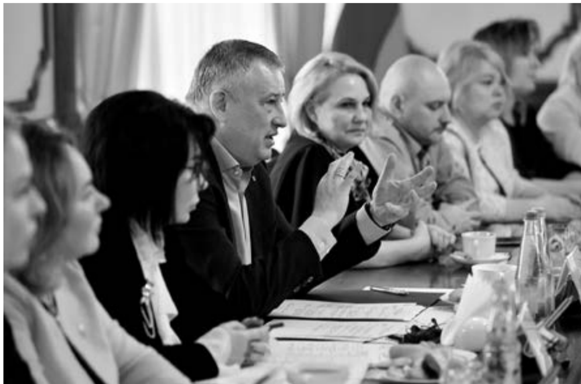
Руководство Ленинградской области на встрече с жёнами участников СВО

В ЛЕНИНГРАДСКОЙ ОБЛАСТИ ДЕЙСТВУЕТ 49 МЕР СОЦИАЛЬНОЙ ПОДДЕРЖКИ УЧАСТНИКОВ СВО И ИХ СЕМЕЙ