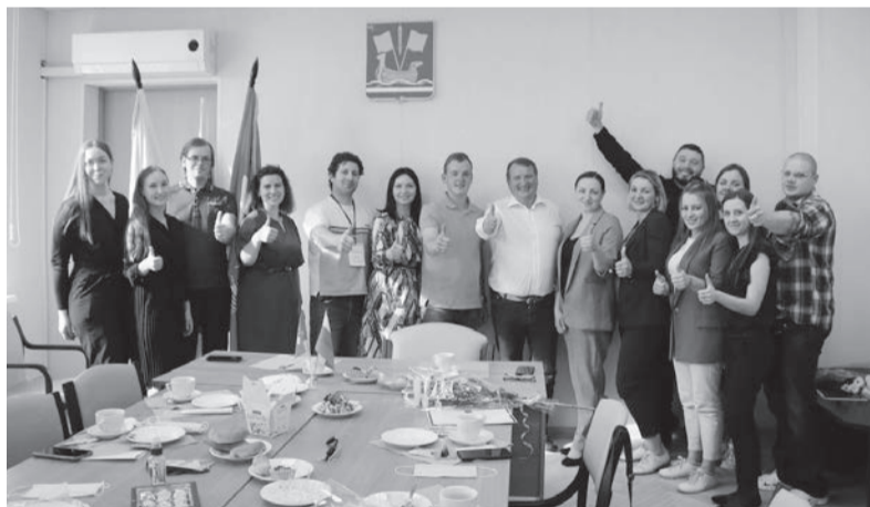
Штабы движения работают во всех районах Ленобласти