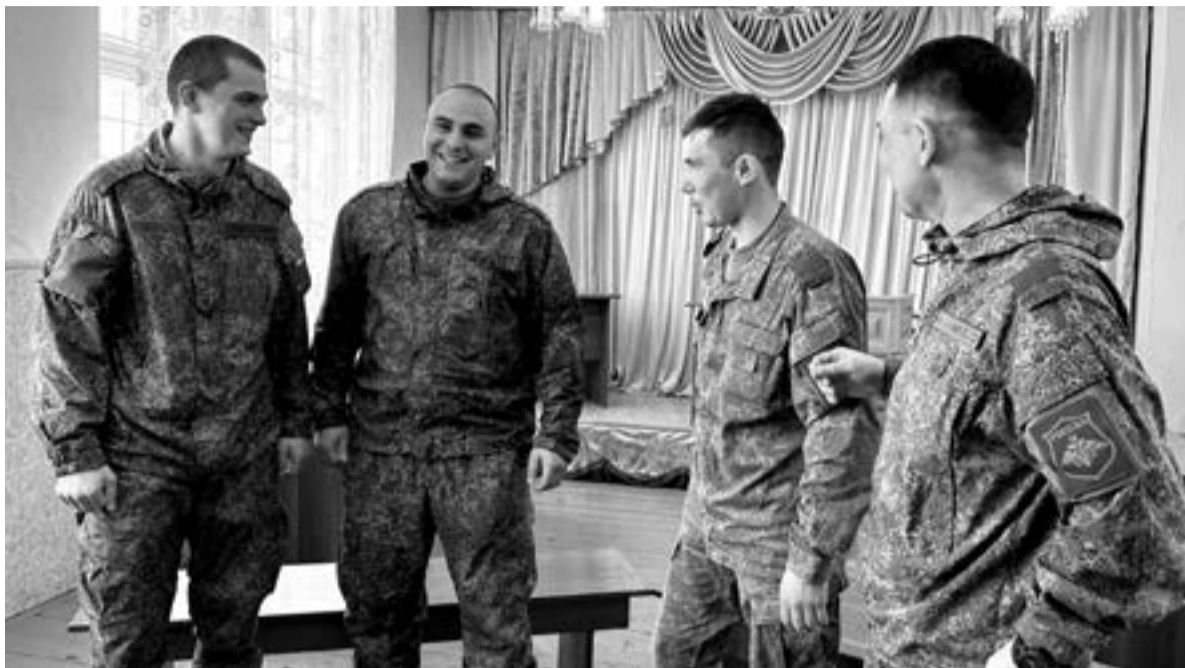
Дух боевого братства ветераны СВО сохранили и по возвращении с фронта

Бобёр любит повторять: «На передовой не страшно толь-