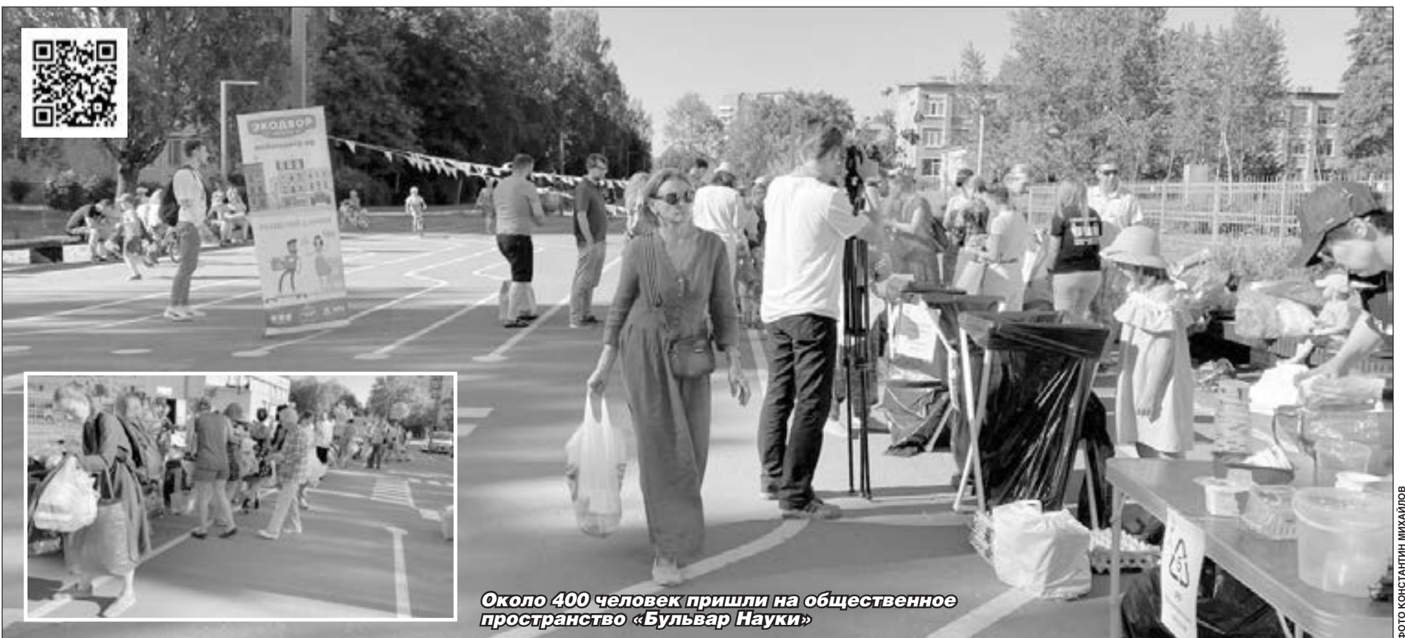
Около 400 человек пришли на общественное пространство «Бульвар Науки»