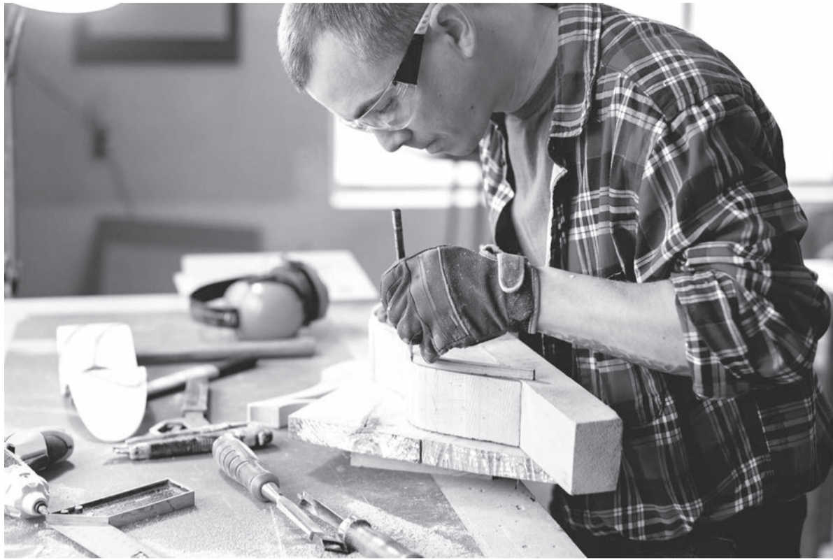
Денги, полученные по соцконтракту на своё дело, можно потратить на приобретение оборудования, инструментов, оргтехники, расходных материалов, на аренду помещения...

По направлению «поиск работы» гражданину необходимо зарегистрироваться в Центре занятости населения и получить статус безработного или ищущего работу. При заключении соцконтракта ему выплатят 15 324 рубля в первый месяц поиска работы, и при трудоустройстве это пособие будут платить ещё три месяца. Также можно рассчитывать на единовременную выплату на курс обучения в