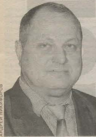
Председатель правления некоммерческого партнерства «Областной центр кредитной кооперации».

* Для участия в рубрике следует прислать или принести в редакцию свое короткое биографическое досье, фотографию и ответ на вопрос. Если вы не успели высказать свое мнение на этой странице, все равно пишите нам, и мы опубликуем его в «Читательской почте».