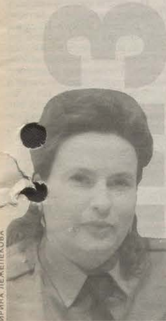
Родилась в 1962 году. Военнослужащая Российской Армии, начальник клуба в/ч 55603.