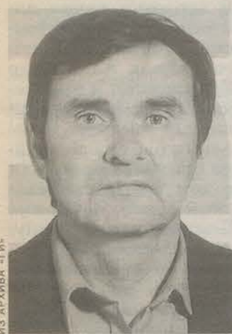
Родился в городе Красногвардейске (Гатчина). Пенсионер.

Мне хотелось бы пожелать в Новом году, чтобы все люди, наш народ, все нации, которые населяют Россию, были более дружны, делили одно общее дело и жили для России.