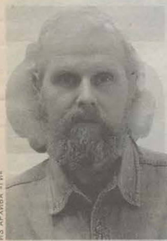
Родился в 1958 году в Гатчине. Преподаватель художественной школы.

Вообще, это сложный вопрос. Бывает, что собрать деньги на благое дело людям помогает Господь, т. е. неожиданно, таинственным образом, откуда-то появляются эти деньги. Это трудно вычислить. Сам я — прихожанин, и как организатор, такие средства не собирал. Но в тех церквях, которые я видел, эти средства часто возникали именно там, где этого никто не ожидал.