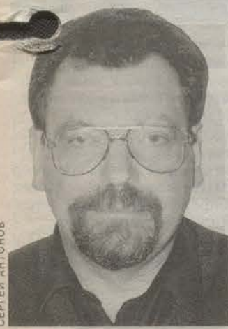
Родился 6 февраля 1960 года в городе Лиепая, Латвийской ССР. Имеет два высших образования: врач, специальность патологоанатом; специалист по социальной работе. Президент Благотворительного общества «Невский Ангел».

Чувство сопереживания, потребность в деятельном милосердии и участия в улучшении качества жизни присуще каждому морально и нравственно здоровому человеку. Так было всегда, так есть теперь, и я верю — так будет всегда. Проблема состоит в количестве пожертвований, а это связано с условиями жизни людей и условиями, которые создаются для благотворительной деятельности, с экономической и политической в стране. Несомненно, что роль СМИ чрезвычайно высока в этом процессе. Я думаю, что эта тематика, поднимаемая редакцией газеты «Гатчина-ИНФО», порадует многих в нашем городе.