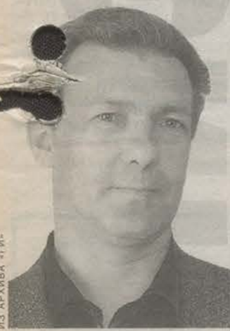
Родился в 1960 году в Новокузнецке. Председатель межрегионального профсоюза «Железнодорожник».