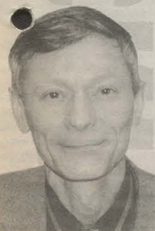
Родился в 1946 году. Закончил ЛИТМО. Депутат ЗАКСа от Гатчины.