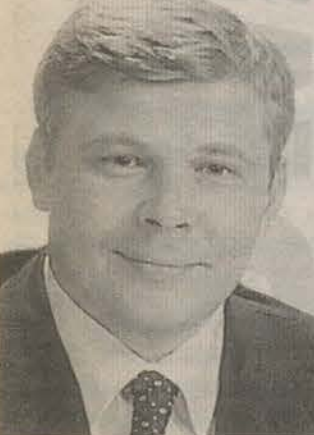
Родился в 1966 году. Закончил Ленинградский медицинский институт им. академика Павлова и Академию государственной службы. Депутат ЗАКСа от Гатчины.