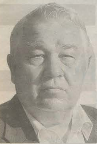
Родился в 1938 году в Бокситогорске. Закончил Ленинградский сельскохозяйственный институт по специальности «зоотехника». Депутат ЗАКСа от Гатчинского района.

Моя позиция: депутат может отстаивать интересы и города, и района. И эта точка зрения имеет право на жизнь.