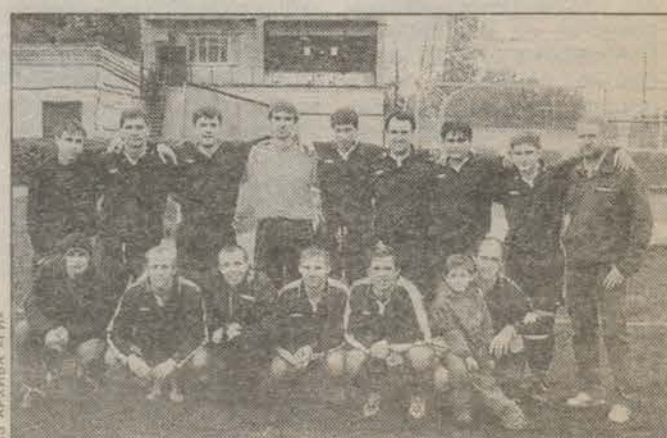
ИЗ АРХИВА «ГИ»