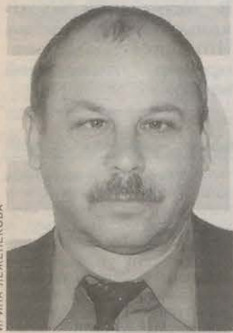
Родился в 1954 году. Закончил Псковский строительный техникум. Начальник СМУ-1 ЗАО «Гатчинский ДСК».

Вопрос следующего номера: *Должна ли власть помогать предпринимателям?