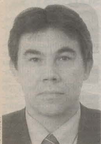
Родился в 1959 году. Главный врач Санкт-Петербургской городской психиатрической больницы № 1 им. П. П. Кащенко. Депутат Гатчинского муниципального района.