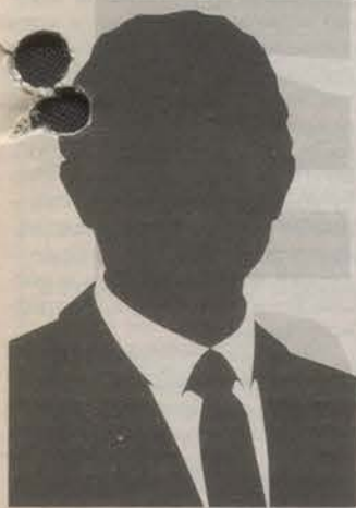
Кандидат культурологических наук, специалист по общественным технологиям, автор книги «Черный PR. Шита и падение»

своему понятию. Так, на этой волне изнутри проявляются происки фашизма, неприязнь друг к другу. Если нас в свое время, начиная с детского сада, учили школе доброжелательного отношения друг к другу, к людям старшего возраста, то сегодня об этом ни на одном уровне не говорится. А ведь с этого и закладывается весь смысл уважения друг к другу. Ведь была идея в школах: октябрята, пионеры, комсомол — все наши пропагандисты в один голос заявляли, что все это не то! А взамен получите — свободные партии скинхедов, лимоновцев. Скоро найдутся (не дай Бог) доброжелатели и профинансируют партию наркоманов, геев, проституток. Хочется закончить обращением к нашим историкам: «Не пытайтесь переписать историю: что было — то было, обратно не вернуть, с этого начинается отношение человека к человеку, и напомнить слова президента США А. Линкольна: «Лучшее, что есть в жизни человека, — это его дружба с другими людьми».