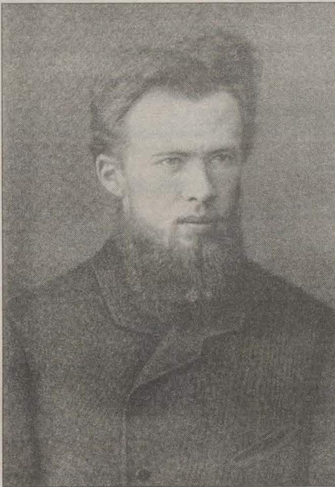
Владимир Афанасьевич Обручев в Иркутске. 1890 год.

Чтобы достичь таких результатов Владимир Афанасьевич выработал распорядок дня, которого неукоснительно придерживался. После раннего подъема, да-