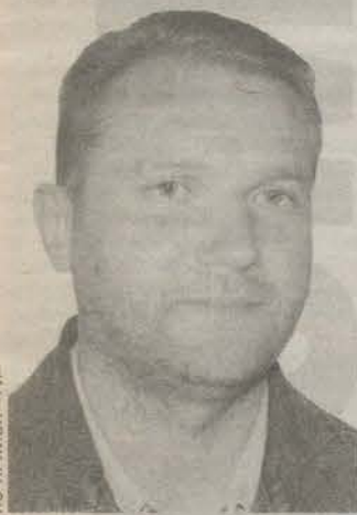
Родился в 1971 году. Закончил Ленинградский областной педагогический университет им. А. С. Пушкина. Директор МОУ «Войсковицкая средняя общеобразовательная школа № 2».