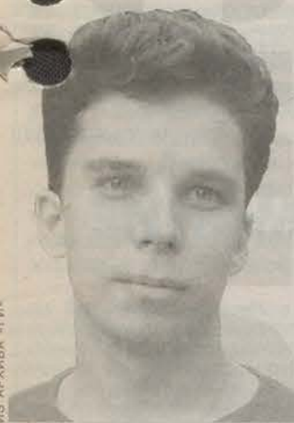
Родился в 1984 году. Студент Санкт-Петербургского государственного университета кино и телевидения. Режиссер-аниматор.

Возможно, часть моих соотечественников, которая так же, как и я, балансирует вокруг этой злосчастной черты бедности, не совсем со мной согласится. Но это, скорее, будут люди озлобленные, сдавшиеся перед теми проблемами, что возникли на их пути, обидевшиеся на свою страну. Я бы очень хотел, чтобы эти люди пересмотрели свою позицию по отношению к данному вопросу, ведь это не спортсмены, не их деятельность привела к такому расслоению нашего общества и отбросила многих из нас за черту бедности. Давайте радоваться успехам спортсменов и страны вместе. А когда в очередном номере газеты будет задан вопрос для размышления «Какое значение имеют успехи в рейтингах журнала «Форбс» (самых богатых людей в мире) для страны, в которой большая часть населения находится за чертой бедности?», тут я вместе с вами готов выступить единым фронтом.