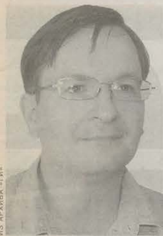
Родился в 1970 году. Окончил Северо-Западный институт. Системный администратор.

кие понятия, как честь страны, гордость за ее лучших представителей, должны воспитываться с детства. Спортсмены, выступающие за свою страну, а не за деньги и ее престиж на мировом уровне, — разве это не пример для подражания? Да, много еще в России малообеспеченных граждан, и долг государства — лучше заботиться о них. Успешные выступления наших спортсменов не должны заслонять все эти проблемы. Наоборот, это должно положительно влиять на отношение власти к простым людям, спланировать и объединить граждан России, улучшать и укреплять взаимоотношения в нашем обществе.