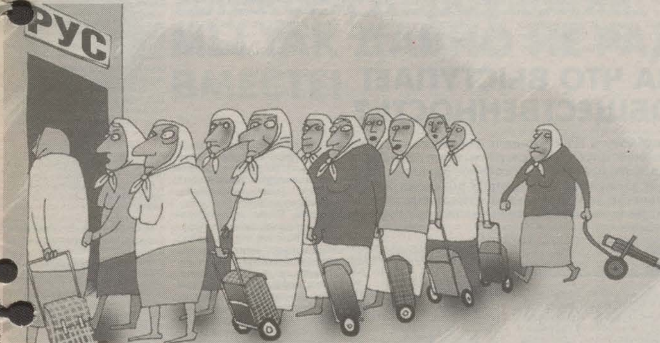
Читайте материал на 2-й полосе.