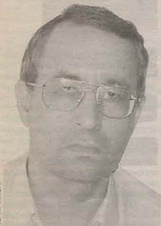
Родился в 1961 году в Хабаровске. Закончил факультет журналистики ЛГУ и Северо-Западную академию госслужбы. Председатель комитета по молодежной политике, спорту и туризму МО «Гатчинский район».