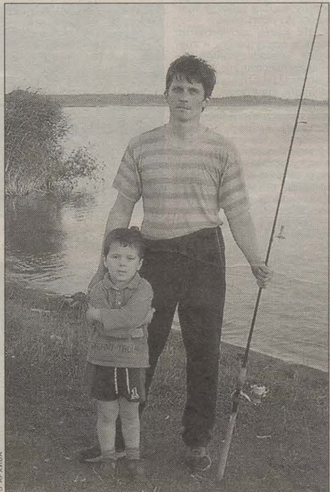
Первые уроки рыбной ловли.

У рыболовов есть такое поверье, что если берешь с собой подсачек (сачок, которым выхватывают из воды больших рыб), то, как правило, большая рыба не клюет. Если подсачек забыл, то, пожалуйста, получите...»