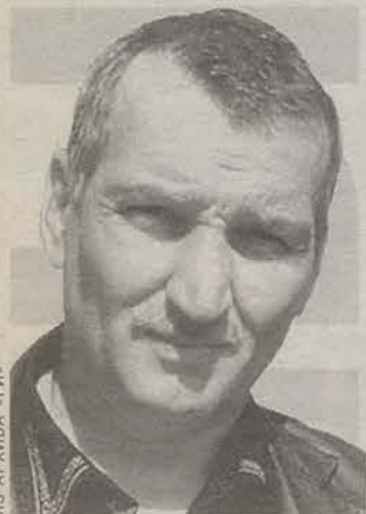
Родился в 1960 году. Имеет высшее образование. Монтажник ГССК.

Вопрос следующего номера: Может ли участок в 6 соток быть экономически выгодным? Или его содержание может быть только, что называется, «для души»? *