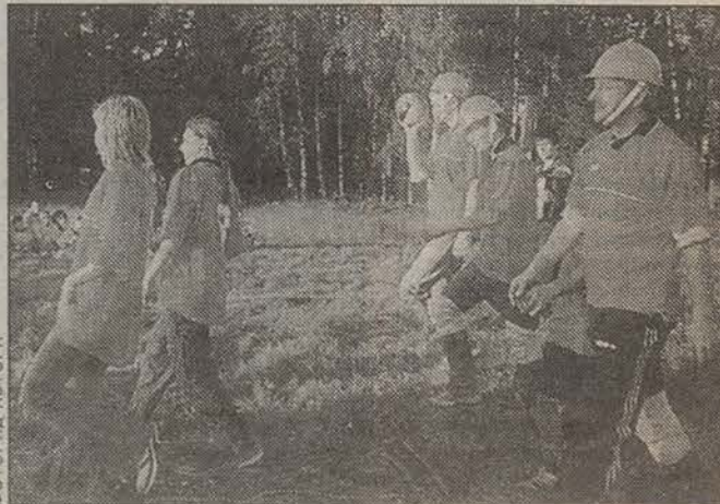
Наши волейболисты — прекрасные артисты.