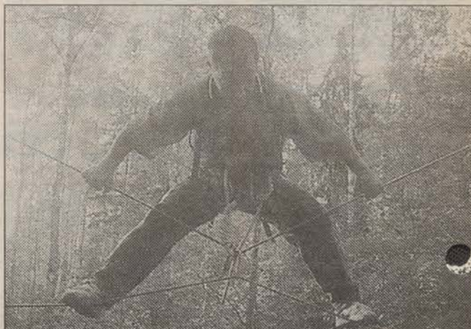
«Бабочка» — самый сложный этап полосы препятствий.