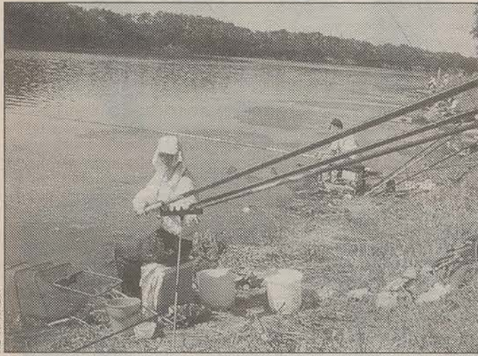
Два в одном — спорт и рыбалка.

какой-нибудь трофейный экземпляр, например, 15-килограммовую щуку.