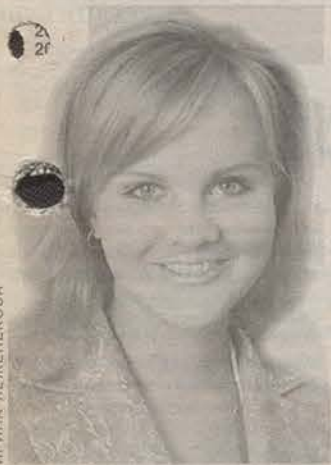
Родилась в 1987 году. Студентка Невского университета. Корреспондент телекомпании «реол-ТВ».

мишь и не расчешешь на пробор всех беспризорных, не уберешь со всех трасс проституток, ни бывшие, ни настоящие бандиты не прячутся по тёмным углам, а предатели... Попробуйте забыть детей Беслана, попробуйте рассказать нашим детям про хороших чеченских моджахедов. А можете рассказать чеченским детям, что все военные хорошие, а их вещи с зачистки повезут домой показать, и пришлют обратно, это если не убиты ещё их родственники. И если об этом всё не говорить и не показывать, то останутся лишь выступления президента и парламентский час. Нельзя приукрасить жизнь, если она плоха, а дети, как никто, это чувствуют.