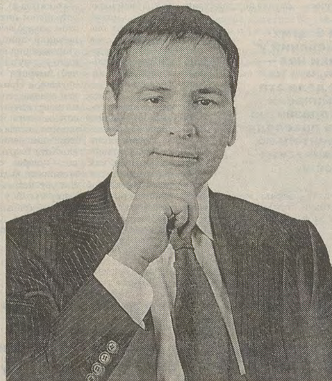
Депутат Государственной Думы России Виталий ЮЖИЛИН.

— Знаете, не «почему», а из-за чего. Вернее, из-за кого. Был такой партийный деятель — Л. М. Каганович. Старикам нашим хорошо известна эта фамилия: один из самых близких Сталину людей. Ну так вот, Каганович женился на очень молодой женщине. А вскоре ему должно было исполниться 55 лет, и он, получается, по возрасту становился пенсионером. Не захотелось ему быть пенсионером при молодой жене. Он и стал инициатором увеличения пенсионного возраста для мужчин. А наши мужчины теперь за эту последнюю любовь Лазаря Моисеевича расплачиваются. Надо положить конец такому «подходу к пенсионной политике».