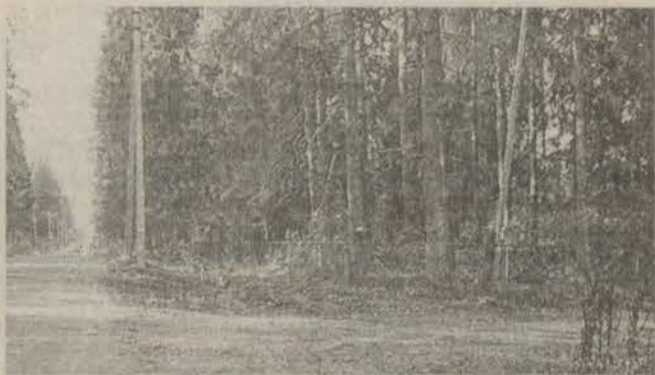
... И такой стала.