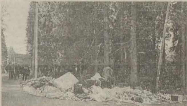
Такой свалка в Сиверской была...

Проблему, конечно, не так просто решить, потому что условия, предлагаемые перевозчикам мусора, пока не выгодны. Об этом должны думать власти, и не только местные. А пока суть да дело, «Новый Свет-ЭКО» поддерживает в чистоте территории бывших шести свалок и регулярно вывозит оттуда мусор, хотя главный профиль этого предприятия — не перевозка, а утилизация отходов на современном полигоне, расположенном на территории Пригородной волости.