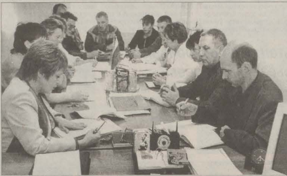
Руководители отделов на ежедневном совещании

Гатчинский молочный завод работает на рынке молочных продуктов уже более пятидесяти лет. Он был построен в 1947-м году. Тогда на заводе трудилось всего три десятка человек, а вся продукция изготавливалась вручную. В 1960-м году полуразрушенные во время войны соседние здания реконструировали, и площадь завода увеличилась почти в десять раз. Открытие, по существу, нового завода состоялось 22 июля 1961 года. Тогда же построили новый цех приемки молока, приобрели флягомоечную машину, установили автоматическую линию для разлива молока в бутылки и организовали творожно-сырковый цех. Новое оборудование позволило значительно увеличить объем и расширить ассортимент выпускаемой продукции.