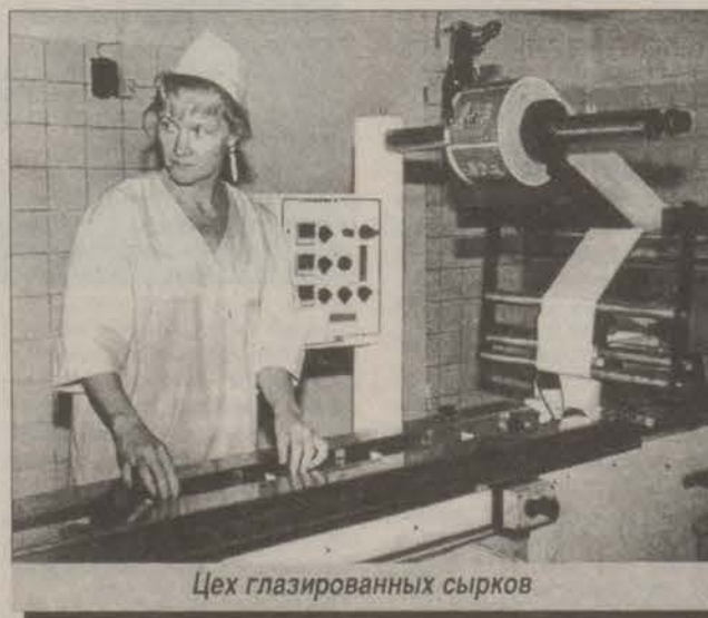
Цех глазированных сырков

Церемония торжественного открытия предприятия «Нива-ГМЗ», которое производит молоко