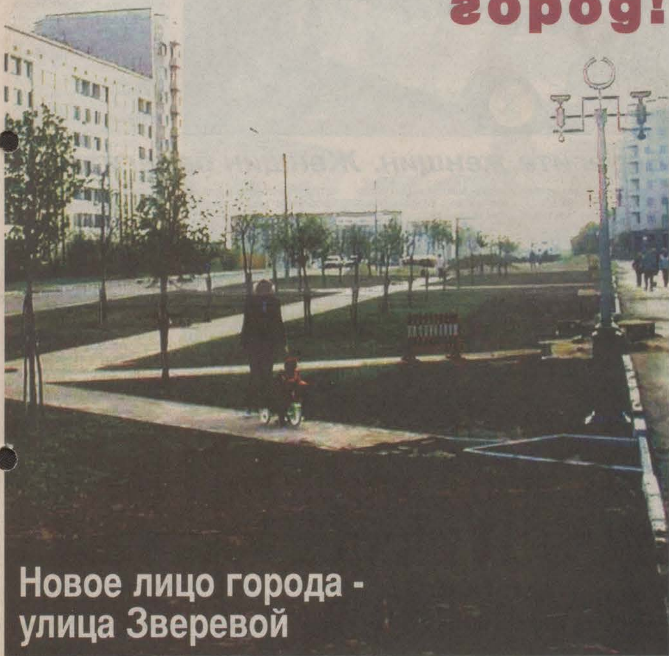
Новое лицо города - улица Зверевой