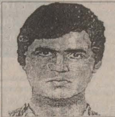
№3: мужчина на вид около 35 лет, рост 150-154 см, азиатский или кавказский тип лица, плотного телосложения, волосы темные. Особые приметы: с левой стороны на верхней челюсти два металлических зуба. С правой стороны на скуле, возможно, шрам.