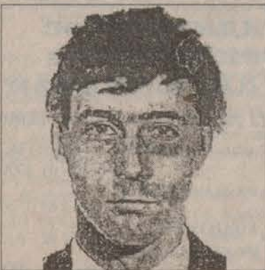
№1: мужчина на вид около 32 лет, рост 175 см, среднего телосложения, волосы темные. Особые приметы: один верхний передний зуб в металлической коронке.

Гатчинским УВД за совершение убийства, сопряженного с разбойным нападением, разыскиваются преступники, по приметам которых составлены композиционные портреты: