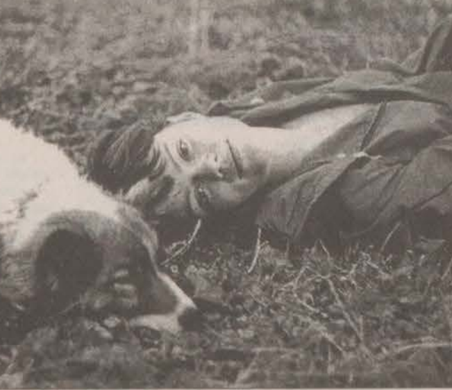
что есть люди или злые силы, которые умеют входить в чужие сны, можно справиться с любыми «фрейдки программами». Ведь это наш сон, а значит, мы в нем слышим. А всякий, кто попытается затронуть кошмар, сам окажется в нем не менее уязвимым.

Если научиться управлять своими снами, то кошмары будут не страшны. Даже если верить в то,