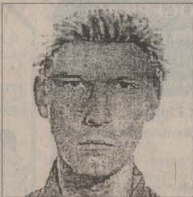
№2: мужчина на вид около 25 лет, рост около 180 см, худощавого телосложения, волосы светлые, короткие.