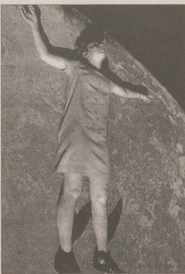
Как ни странно, но эту же теорию, только с религиозной точки зрения, подтверждает специалист по снам священник Александр Ельчанинов: «Во сне исчезает контроль, из глубин всплывают подсознательные основы нашего существа. Таким образом, сны могут характеризовать чистоту нашей души. Порой наяву нам претит какой-либо грех. Но вот мы с удивлением замечаем, что во сне совершаем его и не чувствуем угрызения совести».

Для древних людей сновидения были чем-то мистическим, сверхъестественным. Если человек видел себя во сне далеко от того места, где он в данный момент находился, он знал, это странствует покинувшая тело душа. Во сне его порывали духи предков и давали советы, предостерегали от опасности. Сон и вы имели одинаковое значение, порой сон являлся даже более важным. Люди развивали у себя способность искусственно вызывать сновидения. Путешественники в «теле сновидения» были очень замечательными магами, практиками племён, живших на территории современной Мексики, североамериканских индейцев и других древних культур. В Вавилоне, Греции и Ри-