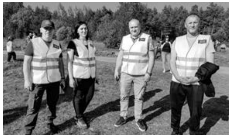
Дружинники из Приозерска помогают полиции на массовых мероприятиях

ТАТЬЯНА ЧУМЕРИНА