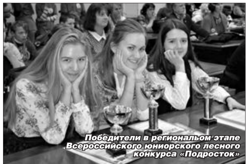
Победители в региональном этапе Всероссийского юниорского лесного конкурса «Подросток»