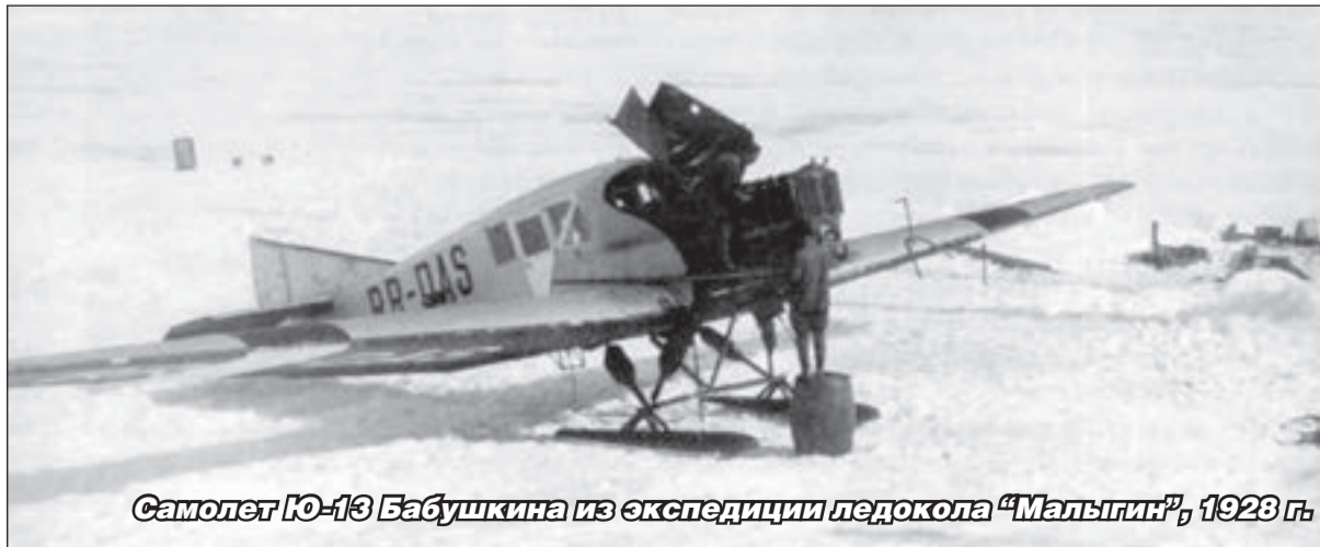
Самолет Ю-13 Бабушкина из экспедиции ледокола «Малыгин», 1928 г.