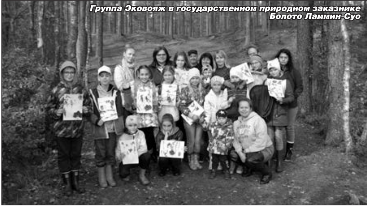
Группа Эковояж в государственном природном заказнике Болото Ламмин-Суо

то выходит на свежий воздух, посидеть на скамеечке перед школой, обменяться новостями и обсудить школьные дела. Коллектив в Толмачёвской школе сложился стабильный, работоспособный. Особо ходит — то там было некогда, поэтому учились развлекать себя сами. Устраивали замечательные вечера, участвовали в художественной самодельности. Однажды стали победителями районного конкурса учительской художественной самодельности, и нас наградили поюзкой в Таллинне».