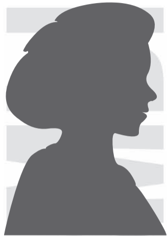
Руководитель службы персонала

Вопрос следующего номера: Знаете ли вы и соблюдаете ли правила движения для пешеходов? Нужно ли напоминать о ПДД для пешеходов, изучать нововведения в них? Или Вы считаете, что за безопасность движения отвечают только водители?