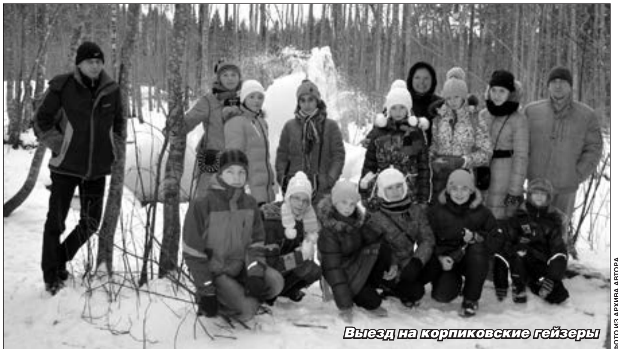
Выезд на корпиковские гейзеры