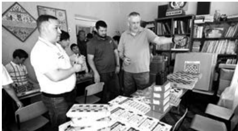
Ленинградская область обновляет книжный фонд в школах и библиотеках Енакиево

— Ленобласть действительно многое сделала на территории Енакиевской агломерации. В которую, помимо самого города Енакиево, входят ещё несколько населённых пунктов. К слову, эти поселения также в порядке шефства распределены за отдельными районами Ленобласти.