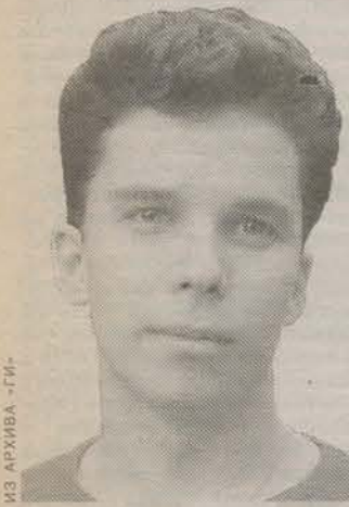
Родился в 1984 году. Студент Санкт-Петербургского государственного университета кино и телевидения. Журналист.

самом деле. В частности, если у человека генетически заложено отвращение к нанесению ущерба другим, он не будет наносить ущерб, даже если соответствующих законов нет. Задумайтесь сами: обычно человек принимает убеждения и совершает поступки не на основе рассуждений, а на основе генетической склонности. Доводы разума имеют лишь вспомогательное значение. Доводы разума имеют лишь вспомогательное значение. Доводы разума имеют лишь вспомогательное значение. Доводы разума имеют лишь вспомогательное значение.