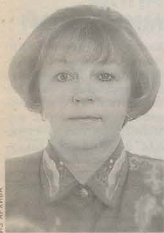
Родилась в Архангельской области. Закончила Ленинградский государственный университет, факультет журналистики. Редактор газеты «Нечаянная радость».

Вопрос следующего номера: Как мы уже сообщали, в Кингисеппском районе женщина убила мужчину, который пытался ее изнасиловать. В результате было возбуждено уголовное дело по статье 108 УК РФ — превышение необходимых мер самообороны. Как Вы оцениваете этот факт?*