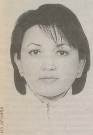
Родилась в Самарканде. Закончила Московский техникум измерений. Менеджер.

Увы, сегодня в нашей стране мы упустили духовное начало, оно у нас в зачаточном состоянии. У людей нет ни страха Божьего, ни человеческого. Мы живем по уму — не по душе и не по совести. Распушенность молодых людей, равнодушие и бездействие взрослых приводят к тому, что красоте под корень сносят. А город у нас красивый. Я хоть и приезжий человек, но сразу полюбила его всей душой. И мне очень грустно наблюдать результаты разрушительной силы. Словом, «печально я смотрю на это поколение...».