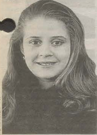
Родилась в Полтаве. Закончила Харьковский государственный университет. Коммерческий директор ООО «Суплет».

На мой взгляд, грузинские и молдавские вина покупатели любят, но думаю, что по качеству они уступают аналогам, которые идут в другие страны. Конечно, за качество вин бороться нужно, и экономическая война, возможно, оправдана, но можно было придумать другие механизмы для ее ведения. По крайней мере, не принимать решения задним числом. Мы, предприниматели, с этим решением федеральных структур бороться не можем.