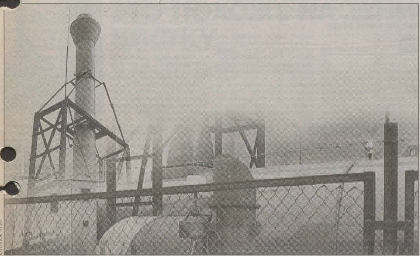
Читайте материал на 2-й странице.