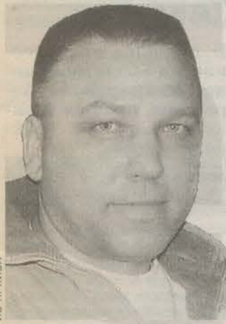
Родился в 1966 году в Вырице. Закончил электромеханическое училище. Директор магазина «Вырицкий», депутат Вырицкого городского поселения.

Вопрос следующего номера: В России принята государственная программа патриотического воспитания молодежи до 2010 года. Как Вы оцениваете ее шансы? Что нужно сделать для того, чтобы она была реализована? *