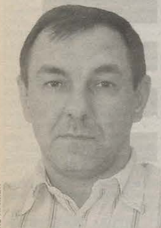
Родился в 1963 году в Москве. Закончил факультет экономики и права Университета дружбы народов им. Патриса Лумумбы. Генеральный директор ЗАО «Бодегас Вальдепабло-Нева».

Не может быть плохим все грузинское или все молдавское вино, а тем более то, на которое уже выданы соответствующие документы.