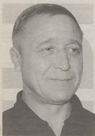
Родился в 1957 году в городе Уваров Тамбовской области. Закончил Лесотехническую Академию им. Кирова. Директор ФГУ «Гатчинский лесхоз».

Вопрос следующего номера: Нравится ли Вам сериал о Сергее Есенине? *