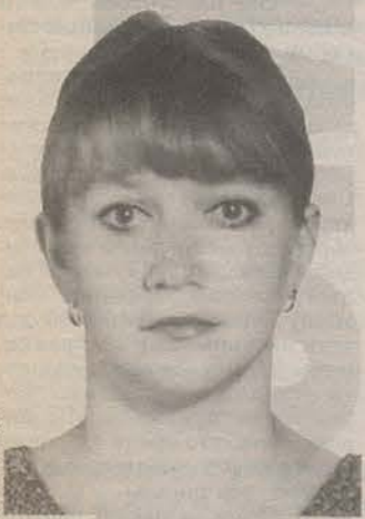
Родилась в 1967 году в Орле. Закончила Орловский государственный университет и Орловский юридический институт.