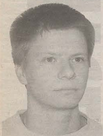
Родился в 1982 году в Ленинграде. Студент факультета журналистики Санкт-Петербургского государственного университета.

зачем понадобилось закончить процесс в подобном спринтерском режиме. И хотя рассмотрение дел в короткие сроки является для Швейцарии, в общем-то, нормой, молниеносность правосудия в данном случае удивила даже специалистов. Процесс фактически отбарабанили за два дня. Возникает вопрос: какой смысл имеет 13-часовое слушание дела в суде и какой сверхчеловек может в зале суда в течение столь длительного времени непрерывно концентрировать свое внимание на том, что там произойдет? Я думаю, что в данном случае все та же фирма опять защищает свои корпоративные интересы. Она до сих пор не хочет признать своей вины по-настоящему. У меня сложилось впечатление, что все специально было так спланировано, так организовано и так представлено.