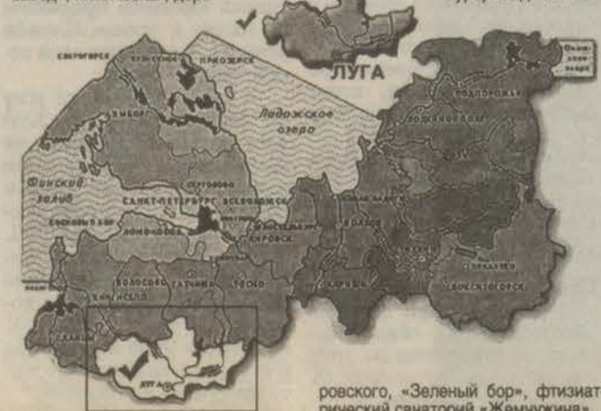
ровского, «Зеленый бор», фтизиатрический санаторий «Жемчужина».

вообрабатывающая, стекольная; сельское хозяйство: мясо-молочное животноводство, картофельводство, коневодство — Государственный племенной конный завод «Звездочка». Здесь расположены курорты: д/о им. Во-