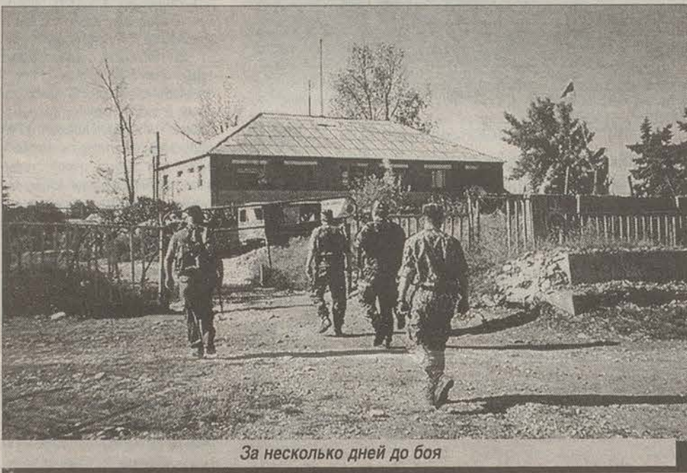
За несколько дней до боя

- Проведенная проверка полностью подтвердила тот факт, что расположение не было оставлено нашим сводным отрядом - мы его не сдали. Мы его просто покинули по-