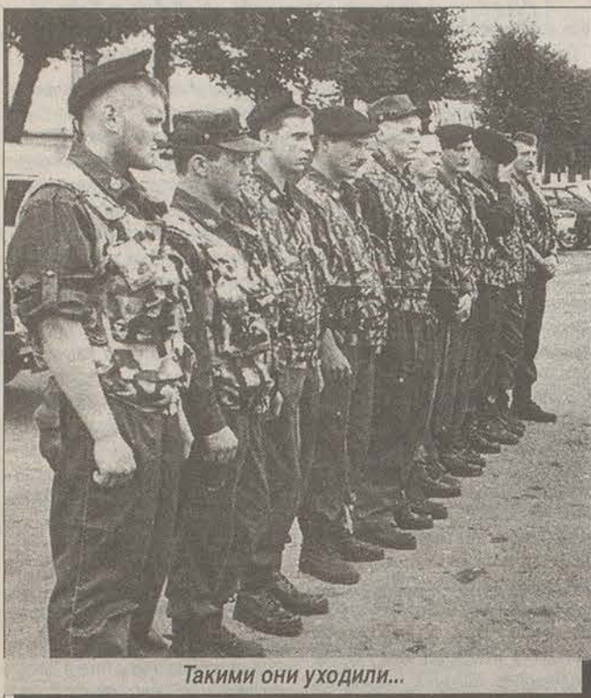
Такими они уходили...