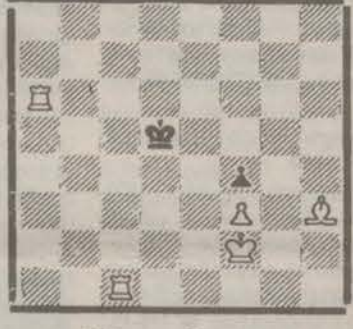
Мат в 3 хода