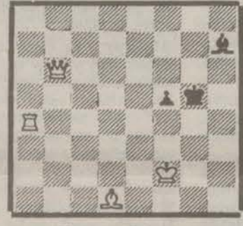
Мат в 2 хода