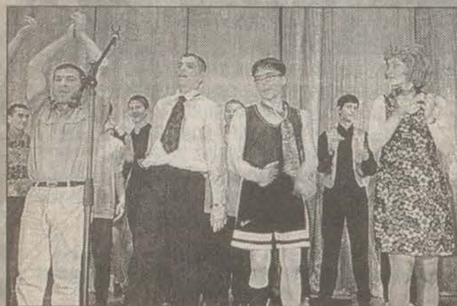
19 мая в кинотеатре «Победа» прошло шоу гатчинских команд КВН: «Взрывной характер», «Раненые пингвины», «Сборная поизф», «Загс», «ЖКК». Зал был полный и отрывался по полной программе.

Ч ЕСТНО ГОВОРЯ, я, когда смотрю КВН по «Ящику», смеюсь мало. А живую, когда всё это видишь, дело другое: смеешься от души, не думаешь о проблемах, просто отдыхаешь. Начало для всех было нежданное и шокирующее. В за-