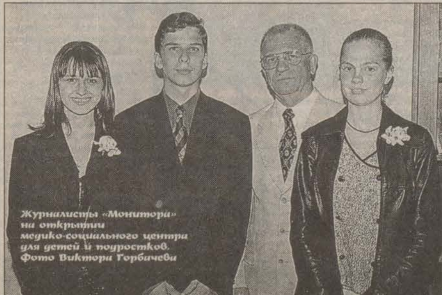
Журналисты «Монитора» на открытии медико-социального центра для детей и подростков.

Р. С.: Ребята, если вы нуждаетесь в совете и помощи, приходите, в медико-социальном центре вас ждут специалисты-медики, они будут рады вам помочь. Записаться на прием или посоветоваться с дежурной медсестрой, к какому именно специалисту обратиться со своей проблемой можно по т. 176-38.