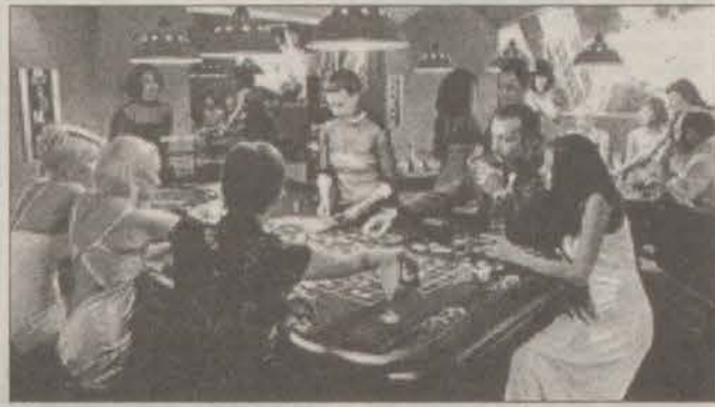
пором - это кроме одиннадцати «заказников».

11 Впечатлительный человек, впервые посетивший игорный зал, непременно почувствовал бы, что воздух здесь словно наэлектризован. Слишком сильные страсти владели сидящими за столиками мужчинами, едва ли не первобытными в своих вождениях. В свете ламп выделялись бледные напряженные лица, блеск охотничьего азарта в глазах, вкрадчивые движения холерных рук. Здесь риск, как в девственно диком лесу. Кто пережил бешеный восторг удачи, хмельное блаженство везения, кто испытал ледяное дыхание развращающейся под ногами бездны, поймет охотника. Какая, в конце концов, разница, несет ли добытчик в свое жилище тушу оленя или кучу долларов? Либо не возвращается вовсе. Опасности в казино столь же смертельны, как и в первобытной чаще. И столь же упоительна победа. Единственное отличие - схватка в диком джунглях не облачена в благопристойные одежды цивилизации, а смерть слишком обывоченна.