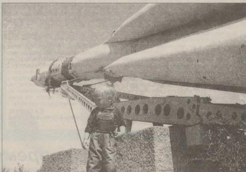
Молодое поколение смотрит в космическое будущее.

Город Ленинск. Символический памятник с установкой ракетносителя «Восток».