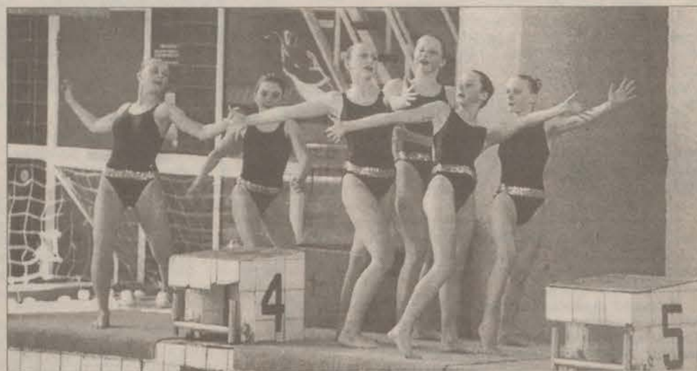
Так они покоряли Москву