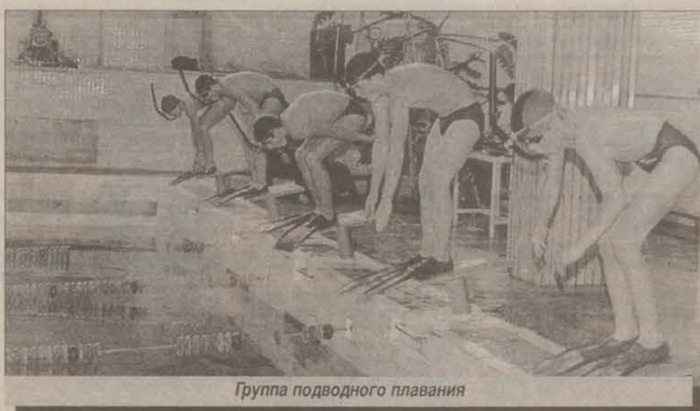
Группа подводного плавания