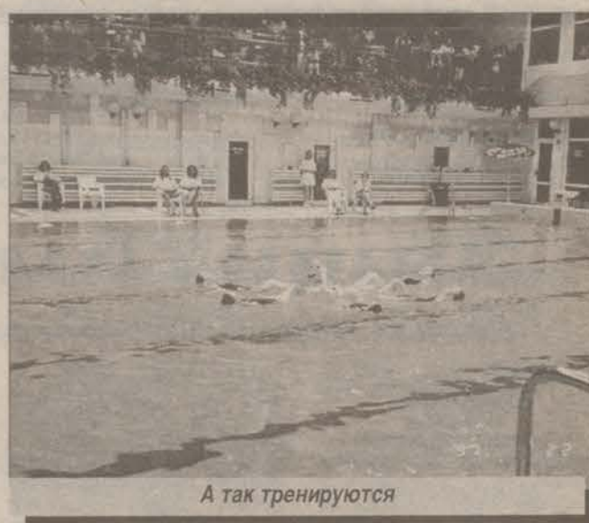
А так тренируются

ную по плаванию я все же формирую, а результаты, наверняка, еще появятся».